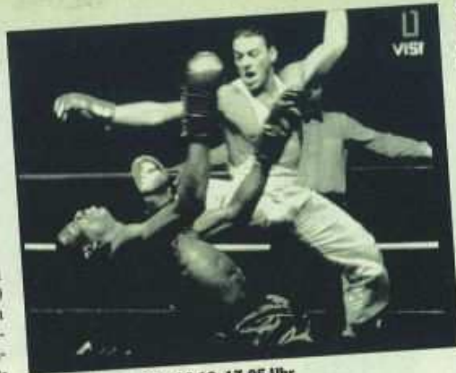
»Karate Tiger«, RTL, 26.12, 17.05 Uhr

Der Bielefelder Jugendforscher Klaus Hurrelmann: »Es hat eine Brutalisierung der Gewalt stattgefunden« – abzulesen auch an den Verletzungen. Polizist Solon berichtet von Kiefer-, Jochbein und Nasenbeinbrüchen bis zu schwersten Kopfverletzungen, oft mit Verlust des Augenglichtes.