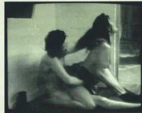
»Gipfel des Terrors«, Premiere, 28. 12., 2.15 Uhr

und die sind nun relativ gewalttätig. Sobald wir aber einen gewissen Marktanteil und damit auch gewisse Einnahmen erreicht hatten, haben wir das umgestellt auf mehr eigene Produktionen. Und wenn Sie heute unser Programmschema anschauen, dann sind da kaum noch Spielfilme oder amerikanische Serien drin. Am Montag kommt »Columbo«, am